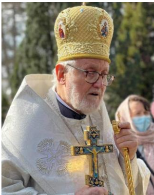
† Митрополит Дубенський ІОАН, Архієпископ Православних Церков у Західній Європі руської традиції